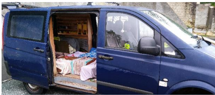
Un van pour les transports chez le vétérinaire

Parmi ces 21 chats tous gris ou noirs, 11 mâles et 10 femelles, dont plusieurs gestantes. Au sein de la portée de chatons de 4-5 mois, trop craintifs pour être socialisés et qui ont donc été opérés avant d'être eux aussi remis en liberté, uniquement des femelles : la relève était assurée et les naissances se seraient enchaînées en 2024 !