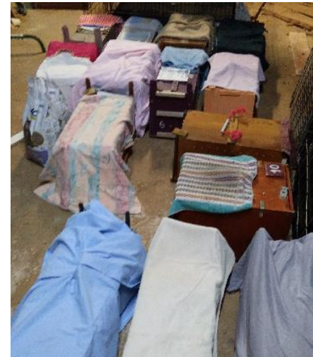
Résultat du premier jour d'intervention

En tout, 21 chats ont été attrapés et stérilisés, dont 15 le premier jour. Ils ont été relâchés sur leur lieu de vie quelques jours plus tard après s'être assuré par une surveillance minutieuse que plus aucun chat ne faisait la navette entre les deux points de nourrissage.